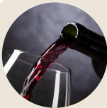
VÍNO una selezione ricca di storia e tradizione