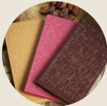
SCHOKOLADE von der Bohne zur Tafel