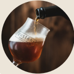
BIER Craftbeer aus Südtirol