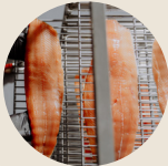
LACHS handgeräucherter Lachs aus den Dolomiten